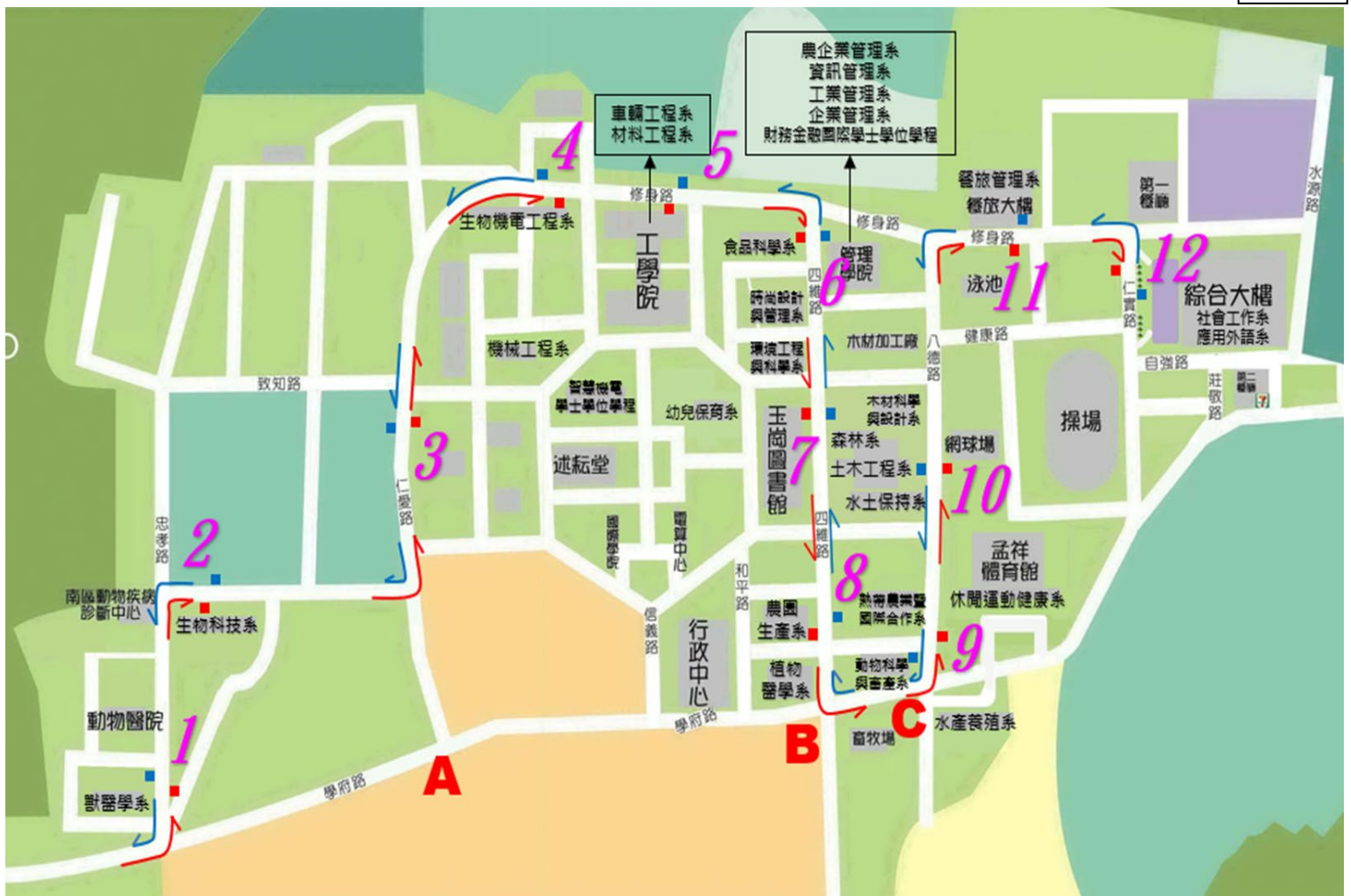
接駁專車校內停靠站(12 站)及重要路口(A~C)交通諮詢人員位置 圖二